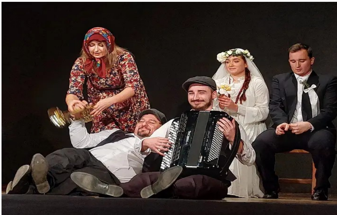
Śpiewająca z Wilczkami spektakl Teatru Przedmieście

GOKiW w przeciągu całego roku organizował warsztaty tematyczne, spotkania z artystami, kiermasze, wystawy, zajęcia dodatkowe, wyjazdy na przeglądy, festiwale taneczne, muzyczne, teatralne na których uczestnicy zajęć prowadzonych w domu kultury odnosili liczne sukcesy reprezentując godnie Gminę Wielopole Skrzyńskie.