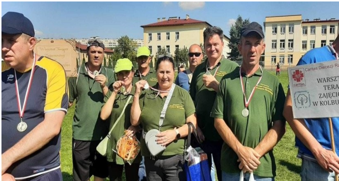
XXIII Olimpiada dla Osób z Niepełną Sprawnością w Rzeszowie