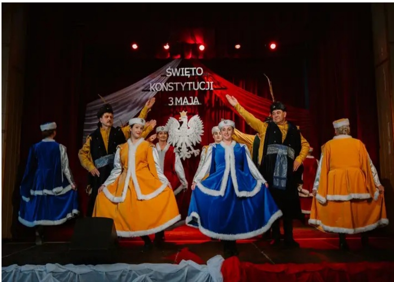
Gminne Obchody Uchwalenia Konstytucji III Maja