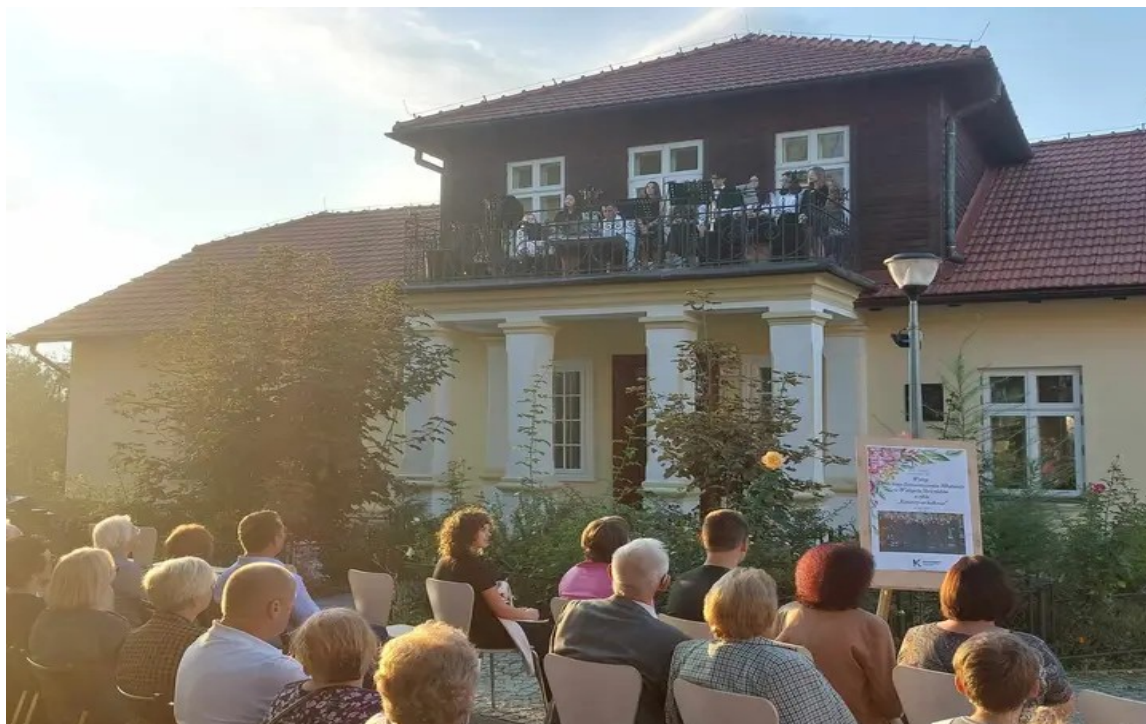
Koncerty na balkonie

Magazyn muzealny, który powstał w 2020 roku i od tego czasu jest on systematycznie uzupełniany przez nowe obiekty, które udało się zgromadzić. Zapełnia się z dnia na dzień. Każda rzecz, która trafia do magazynu, zostaje wpisana do inwentarza, sfotografowana i opisana (jej stan techniczny, pochodzenie, autor, cała historia) ale przede wszystkim oczyszczona i zabezpieczona.