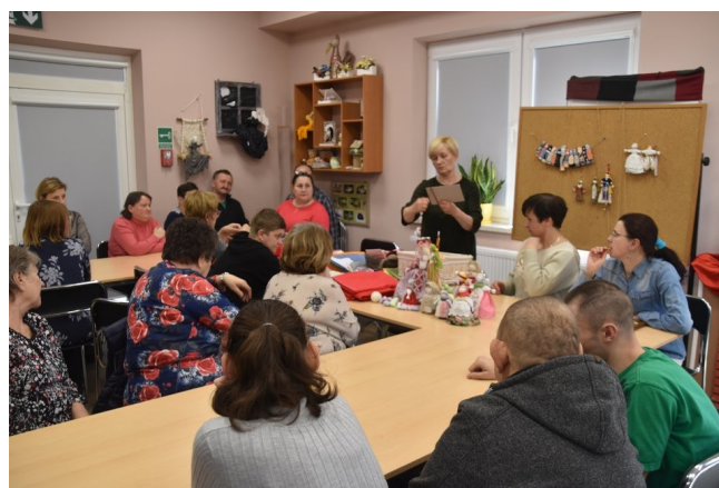
Warsztaty z wykonywania lalek motanek