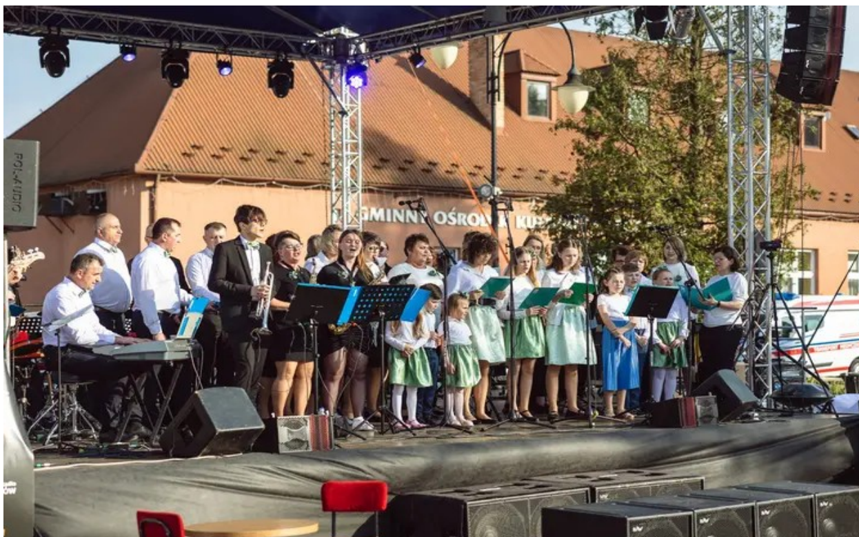
Zespół muzyczny AKORD