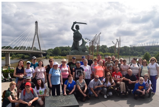
Wycieczka do Warszawy