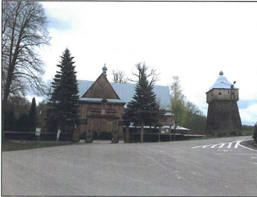
Fot. 1. Brzeziny, kościół p.. Św. Mikołaja Bpa, fot. K. Oleszek.

Gminny Program Opieki nad Zabytkami dla Gminy Wielopole Skrzyńskie na lata 2017-2020