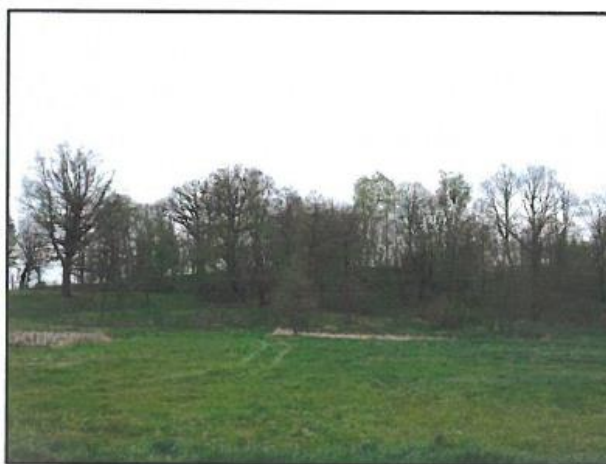
Fot. 5. Brzeziny, zespół dworski, w ruinie.

Dwór przetrwał szczęśliwie obie wojny światowe. Remontowany po rabacji, następnie w 1905 roku, w latach 1936-1939 otrzymał nowe posadzki. Wtedy też podmurowano częściowo ściany zewnętrzne. Reforma rolna w 1944 roku była początkiem jego upadku. Ogołcony z resztek wyposażenia tkwił w samotności jak niemy wyrzut sumienia. Doraźnie wykorzystywany i remontowany na zasadzie łatania dziur w dachu i podpierania ścian, ostatecznie popadł w ruinę. Dziś próżno by szukać śladów dawnej chwały choć zamysł architektoniczny wciąż jest czytelny i wciąż skłania do zadumy i refleksji nad nieubłaganym przemijaniem. Szanse na jego ratunek jeszcze istnieją ale maleją z każdym rokiem.