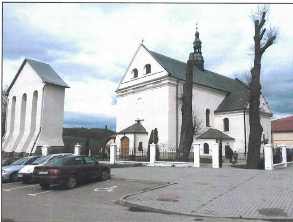
Fot. 8. Wielopole Skrzyńska, kościół p.w. Wniebowzięcia NMP.