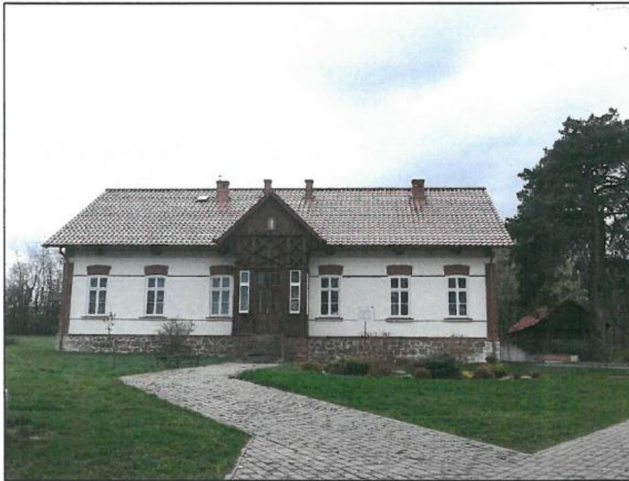
Fot. 3. Brzeziny, plebania, fot. K. Oleszek.

Gminny Program Opieki nad Zabytkami dla Gminy Wielopole Skrzyńskie na lata 2017-2020