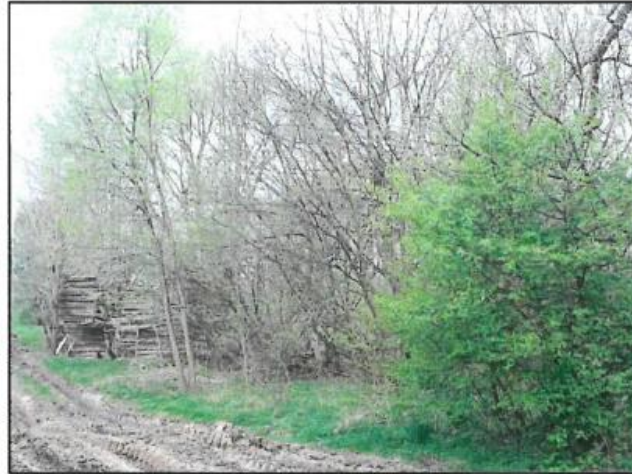
Fot. 6. Brzeziny, zespół dworski – park podworski.

Gminny Program Opieki nad Zabytkami dla Gminy Wielopole Skrzyńskie na lata 2017-2020