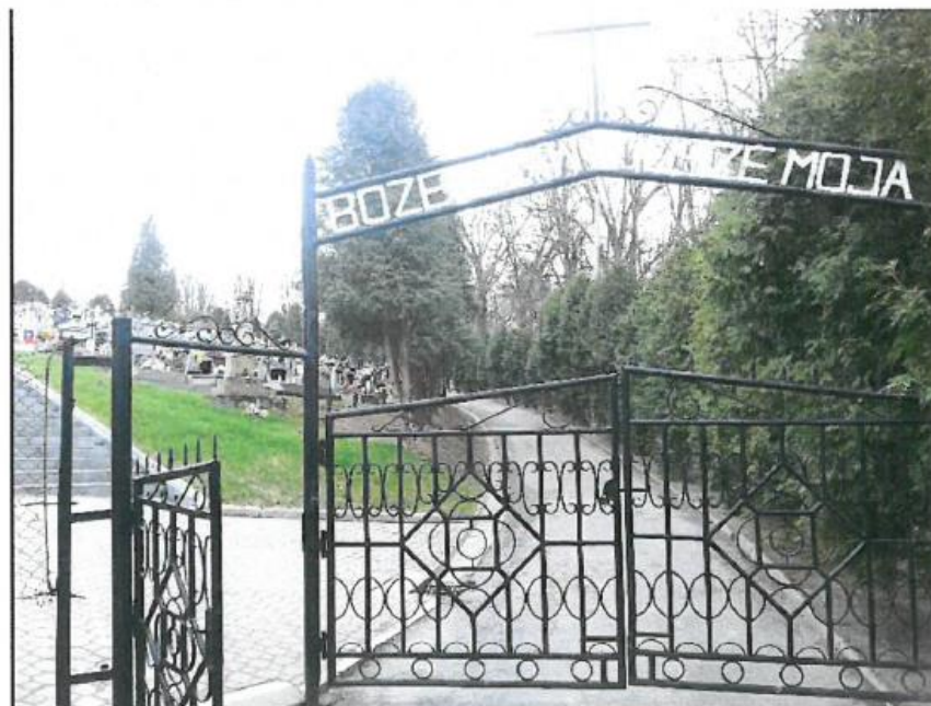
Fot. 4. Brzeziny, cmentarz.