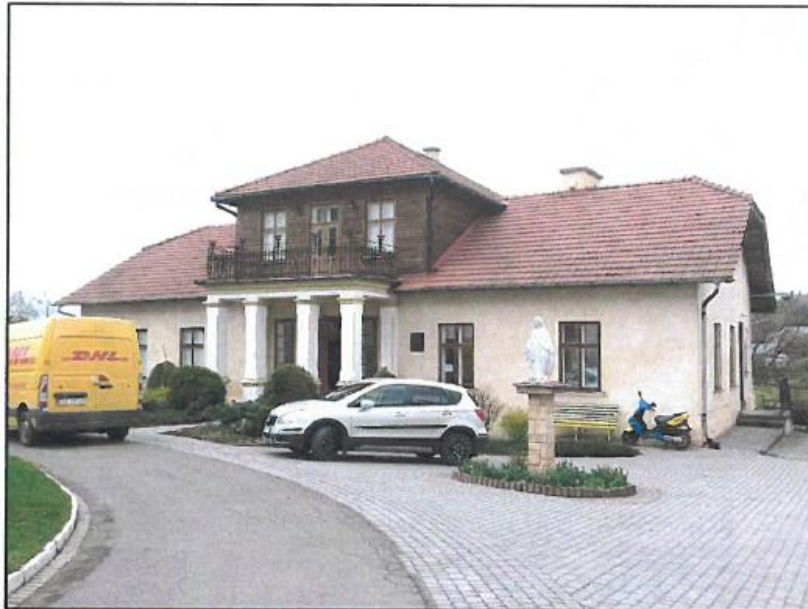
Fot. 7. Wielopole Skrzyńskie, plebania.