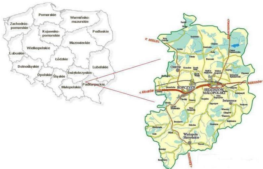
Ryc. 1. Położenie Gminy Wielopole Skrzyńskie (źródło: www.wielopole.eu ).